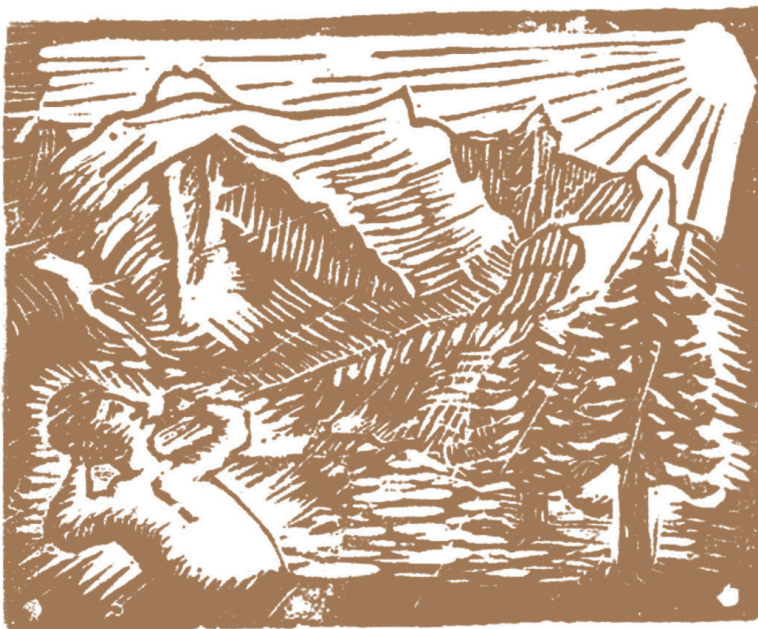
Illustration : Journal scolaire Face au Mont-Blanc réalisé par les élèves de l'école mixte du Chef-lieu de Passy, canton de Saint-Gervais, mai 1946.